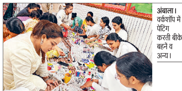
अंबाला। वर्कशॉप में पेंटिंग करती बीके बहन व अन्य।