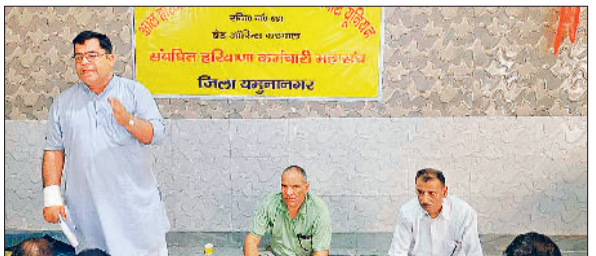
यमुनानगर। श्रीराम भवन जगाचरी में आयोजित बैठक में कर्मचारियों को संबोधित करते यूनियन के प्रधान।

हरियाणा कर्मचारी महासंघ से संबंधित ऑल हरियाणा पीडब्ल्यूडी मैकेनिकल कर्मचारी यूनियन रजिस्टर नंबर 681 हाई पावर कमेटी की ओर से कार्यकर्ता सम्मेलन का आयोजन किया गया। श्रीराम भवन