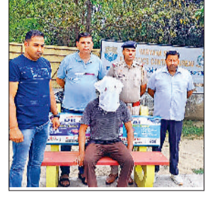
नशीली गोलियों के साथ पकड़ा गया आरोपी शखर।

हरियाणा राज्य नारकोटिक्स कंट्रोल ब्यूरो ने नशीली दवाओं की तस्करी के आरोप में एक युवक को काबू किया है। पुलिस ने आरोपी के कब्जे से 1125 नशीली गोलियां जब्त की हैं। अब उसके खिलाफ एनडीपीएस एक्ट के तहत केस दर्ज किया है। दरअसल हरियाणा एनसीबी यूनिट कुरुक्षेत्र को सूचना मिली थी कि जिले में नशीली दवाओं की एक