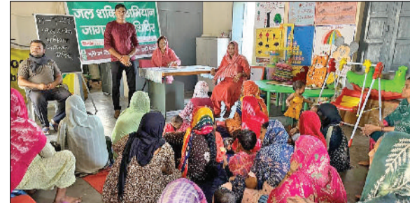
इंदी के गांव कलरी खालसा में लोगों को जागरूक करते कृषि विभाग के अधिकारी ।

जीवन है, हम पानी की अहमियत से अनजान बने हुए हैं और लगातार इसकी बर्बादी कर रहे हैं। हम इसकी इतनी बर्बादी कर रहे हैं कि हमें यह साधारण सी चीज लगती है लेकिन यह साधारण सी चीज असल में बहुत अनमोल है। उन्होंने कहा कि अगर पब्लिक क्षेत्र में कहीं