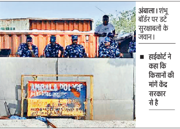
अंबाला। शंभू बॉर्डर पर डट कर सुरक्षाबलों के जवान।

हाईकोर्ट ने यह भी कहा कि हम लोकतंत्र देश में रह रहे हैं। किसानों को हरियाणा में घुसने से नहीं रोक सकते। उल्लेखनीय है